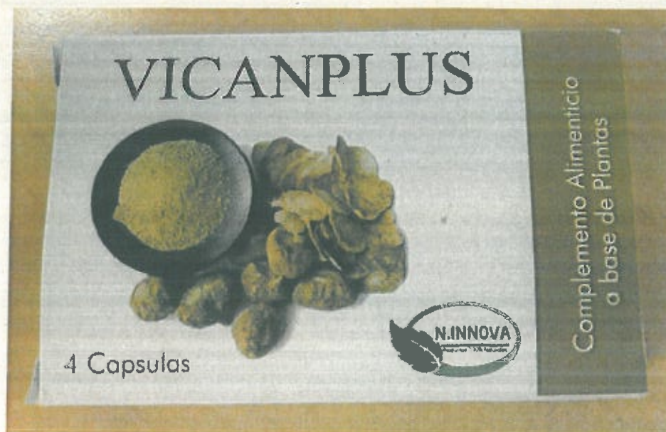
Fig.1: Imagen del producto VICANPLUS cápsulas.

La prohibición de la comercialización y la retirada del mercado de todos los ejemplares del citado producto.